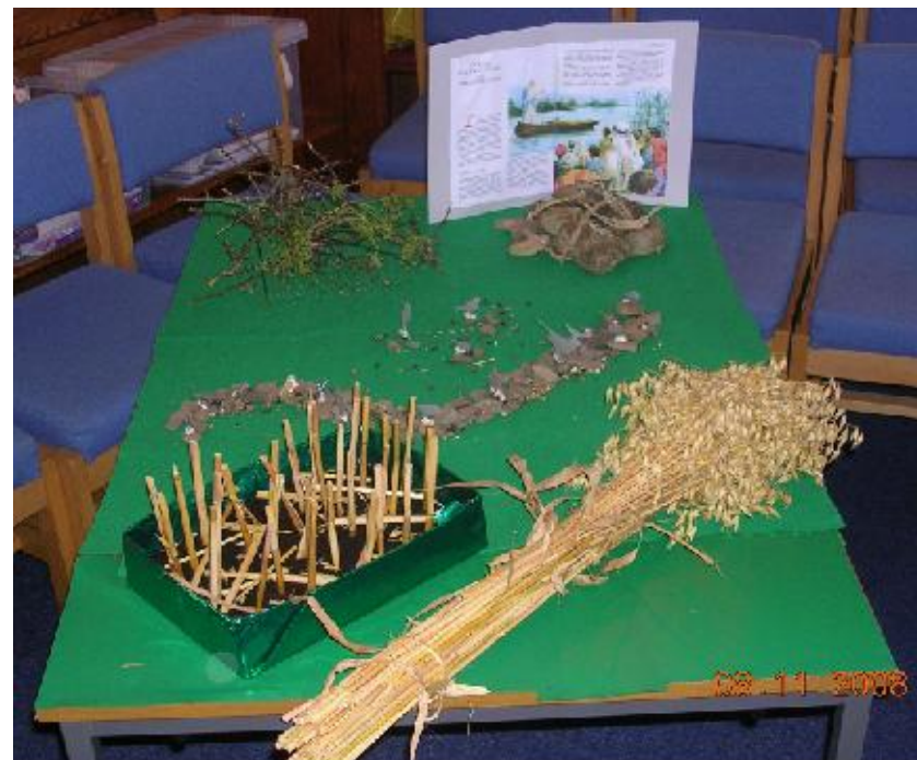
Damhegion yr Heuwr a'r Deg Gwahanglwyf gan aelodau Ysgol Sul Capel Seion

Erys dylanwad Babilon arnom yn y modd yr ydym yn mesur amser gan mai ar y rhif 60 yr oedd eu mathemateg yn seiliedig. Roedd ynt hefyd yn hoff iawn o arbrofi gyda darogan y dyfodol. Ar ddiwedd yr arddangosfa dangosir ffilm o Fabilon heddiw, sydd, wrth gwrs, yn Irac. Gerllaw olion archaeolegol y ddinas wreiddiol roedd Saddam Hussein wedi adeiladu palas ysblennydd a defnyddiai byddinoedd y cynghreiriaid y safle hynafol hwn fel man glanio i'w hofrenyddion. Terfynir felly gyda phle am warchod yr hyn sydd ar ôl yn well i'r cenedlaethau a ddaw.