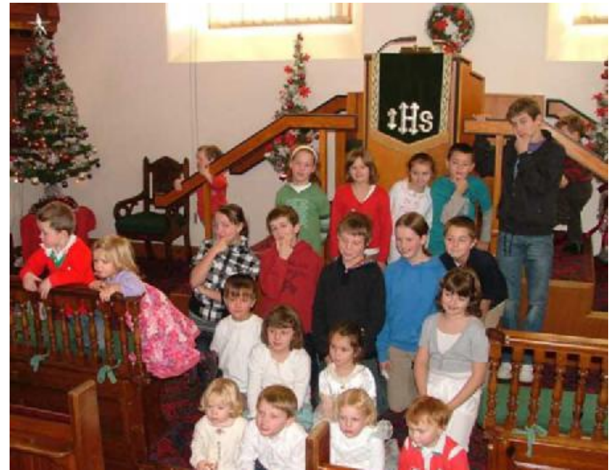
Plant y Garn yn dilyn eu gwasanaeth Nadolig 'Pasio'r Parsel'

A dyna'r unig obaith i ninnau ac i'n byd cythryblus ar ddechrau 2009. Y mae Paul yn Effesiaid 5:8 yn ein hannog i 'fyw fel plant y goleuni'.